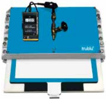
Калибровочное устройство trublü®

С помощью калибровочного устройства trublü® все датчики системы pedar®-x калибруются индивидуально, используя известное давление воздуха. Эта процедура выполняется с